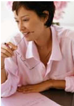
Ein Arbeitszeugnis muss sehr sorgfältig formuliert werden.